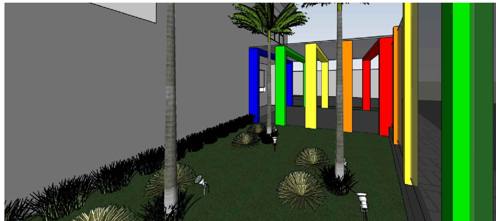
Perspectivas Sem Escala